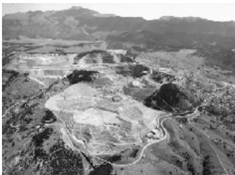
Рис. 1. Рудник Крессон, Крипл Крик, Колорадо; на заднем плане видна гора

За отложением пород вулканического комплекса сразу последовала минерализация, проходившая в две стадии. Сначала поток жидкости высокой температуры изменил структуру вмещающих вулканических пород и увеличил их проницаемость. Затем поток жидкости низкой температуры привел к отложениям в глубине погруженных жилах, рассеивая частицы золота в пористых вмещающих породах. 9