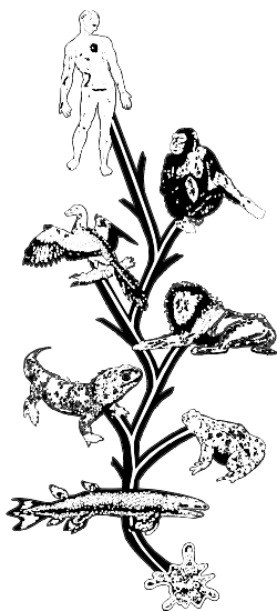
ЭВОЛЮЦИОННОЕ "ДРЕВО ЖИЗНИ" все промежуточные звенья "утрачены"

Сейчас, 130 лет спустя, летопись окаменелостей продолжает быть главным камнем преткновения для эволюционистов. Пресловутые "промежуточные" или, как их еще называют, "утраченные" звенья не найдены по сей день. В музеях мира содержатся миллионы окаменелостей, но среди них вы не найдете ни одной переходной формы от одного класса к другому! Даже знаменитый археоптерикс в свете новых открытий больше не может считаться промежуточным звеном между рептилиями и птицами. Летопись окаменелостей ясно свидетельствует о том, что в живой природе всегда существовали лишь самостоятельные типы. Внутри каждого из них всегда было множество разновидностей (к примеру, многообразные породы собак), но границы между ними — непреодолимы! Таким образом, данные наблюдения убедительно показывают нам, что жизнь на Земле была сотворена, как с самого начала и говорится в Библии.